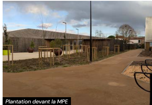
Plantation devant la MPE

Le projet des Genêts illustre parfaitement qu'une politique publique pensée et réfléchie en amont peut transformer durablement un quartier entier. Ces politiques, qui s'inscrivent dans une vision à long terme, témoignent d'une ambition claire : améliorer le quotidien des habitants tout en répondant aux défis environnementaux. Les travaux, parfois perçus comme perturbants au