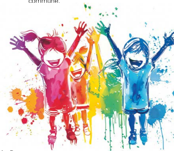
Natacha Bonneau, 49 ans

Depuis le 1 er janvier 2025, le dispositif Coup de pouce aux activités de loisirs offre une aide financière pour soutenir les familles boiséennes. Pensée pour accompagner les foyers les plus touchés par l'inflation et les difficultés économiques, cette aide vise à faciliter l'accès aux clubs sportifs et associations de la commune.