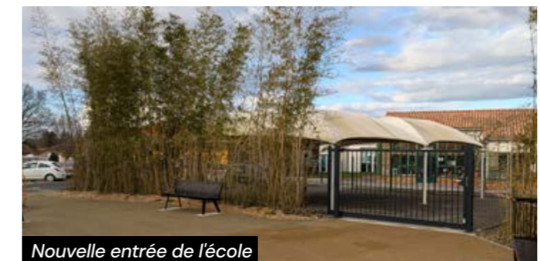
Nouvelle entrée de l'école

Cette transformation prouve que des travaux, souvent perçus comme des désagréments au quotidien, s'inscrivent dans une stratégie globale d'amélioration du cadre de vie. En repensant l'aménagement avec soin et en concertation, la commune a su répondre aux besoins immédiats tout en anticipant les défis climatiques et sociétaux. À terme, ces efforts portent leurs fruits en créant un environnement durable, agréable et harmonieux pour tous