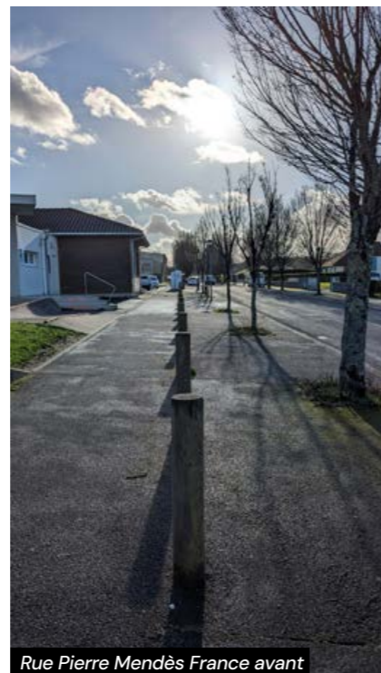
Rue Pierre Mendès France avant

Par ailleurs, l'entrée de l'école maternelle a été modifiée dans le cadre des travaux. Désormais éloignée du parking, cette nouvelle disposition offre un espace plus sécurisé pour les enfants, en particulier durant les heures d'entrée et de sortie de l'école. Les familles peuvent ainsi accéder à l'établissement dans des conditions apaisées, renforçant la sécurité et le confort de toutes et tous.