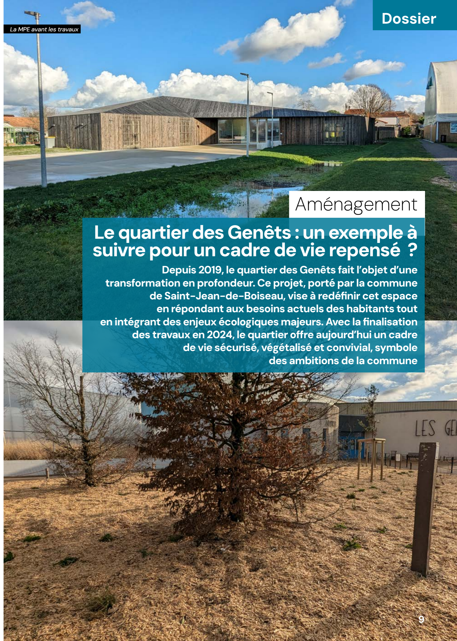
La MPE avant les travaux

Saint-Jean-de-Boiseau accueillera un spectacle unique à la salle des Pierres Blanches le jeudi 3 avril à 20 h : « De Bouche à Oreille ». Les Sœurs Tartellini, artistes pétillantes, offriront un voyage joyeux et chaleureux à travers des récits et musiques du monde. Des moments d'échanges et de convivialité avec des associations locales sont prévus avant et après le spectacle.