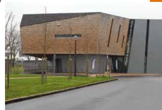
Maison de Quartier Grande Ouche CLIC Loire-Acheneau.

Toutes les permanences dans les 7 communes autres que celles de Bouguenais sont assurées de septembre à juin (sauf juillet et août). Chacune des permanences est ouverte aux habitants des 8 communes, quel que soit le lieu de résidence sur le territoire du CLIC. Pour chaque rencontre lors de ces permanences, il est nécessaire de contacter le CLIC pour fixer un rendez-vous.